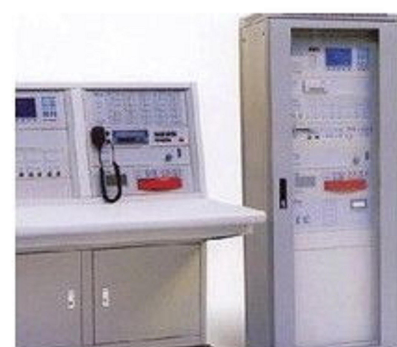
火灾自动报警系统